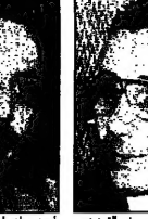
خبر بون بوعزيزي وزير العدل الجزائري